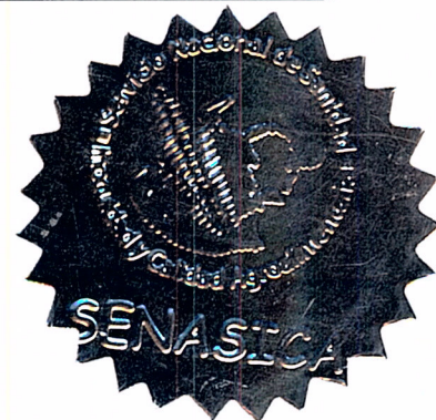
MVZ. OCTAVIO CARRANZA DE MENDOZA